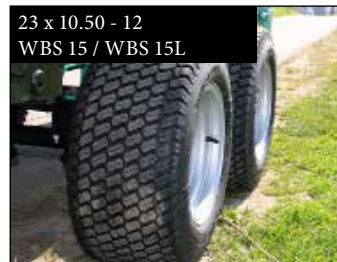
23 x 10.50 - 12 WBS 15 / WBS 15L