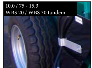
10.0 / 75 - 15.3 WBS 20 / WBS 30 tandem