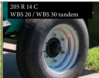
205 R 14 C WBS 20 / WBS 30 tandem