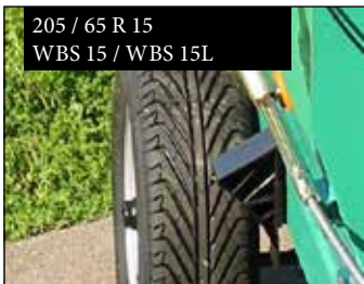
205 / 65 R 15 WBS 15 / WBS 15L